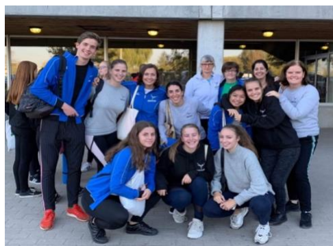
Deelnemers aan een vorig kaderweekend