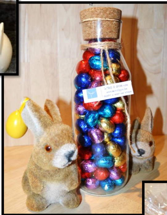
fles met kurk