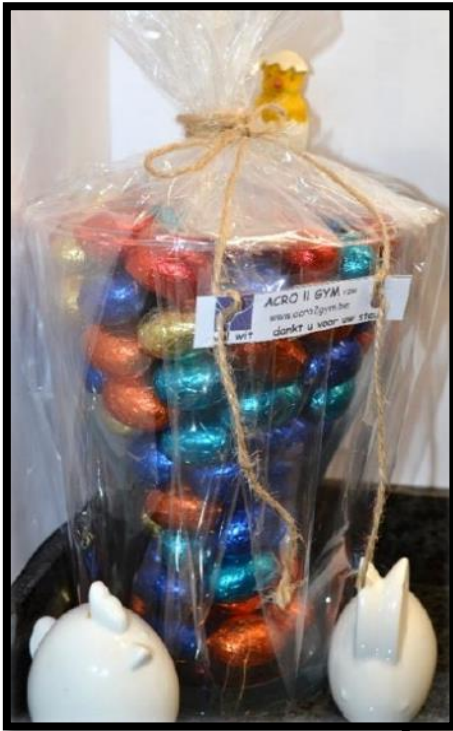
grote glazen vaas